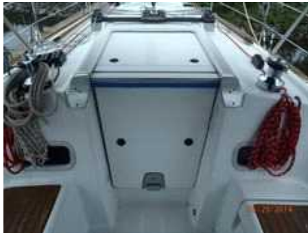
37. 해치 및 승강구 등의 출입구를 수밀상태로 닫을 수 있는가