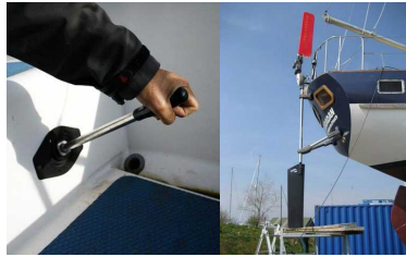
34. 비상용 킬러나 조종장치를 가지고 있는가