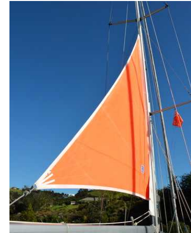
36. 트라이슬이 있는가 (충분한 메인세일 축범이 가능한가)