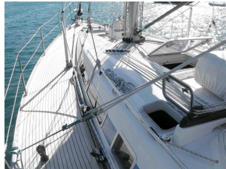
38. 데크, 선실에 무거운 물품들이 잘 고정되어 있는가