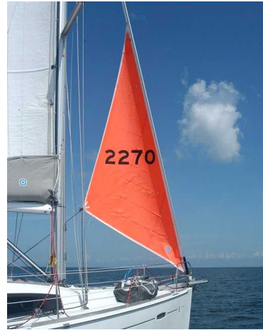
35. 스톱집이나 헤비웨더집이 있는가