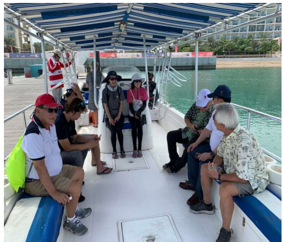
대회 관람정 탑승한 각 국가 요트 협회 대표단