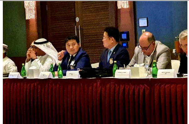
총회 중 발의