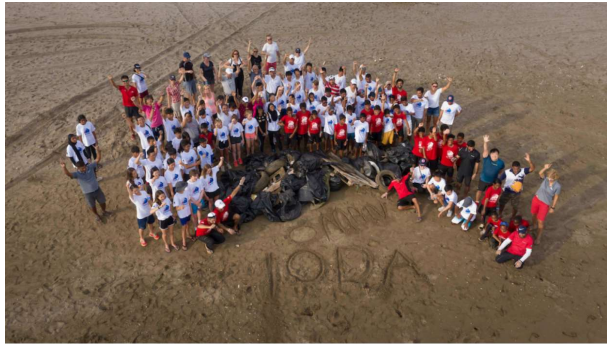
대회 전 아침 청소 후 기념 사진