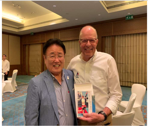
대한요트협회 회장과 세계 요트 총회 회장 인사 및 선물 증정