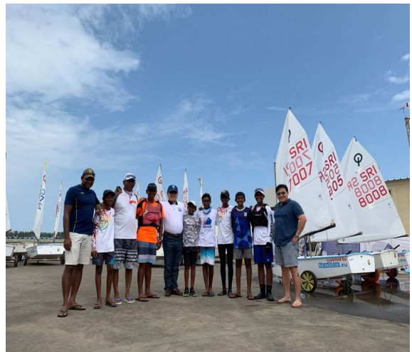
IODA 아시아 오세아니아 선수권 대회 참가자 격려 (스리랑카 대표 팀)