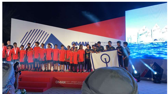
올해 ODA 아시아 오세아니아 선수권 대회 주최 (오만) 선수들이 내년 대회 주최자 (스리랑카) 선수들에게 깃발 넘김