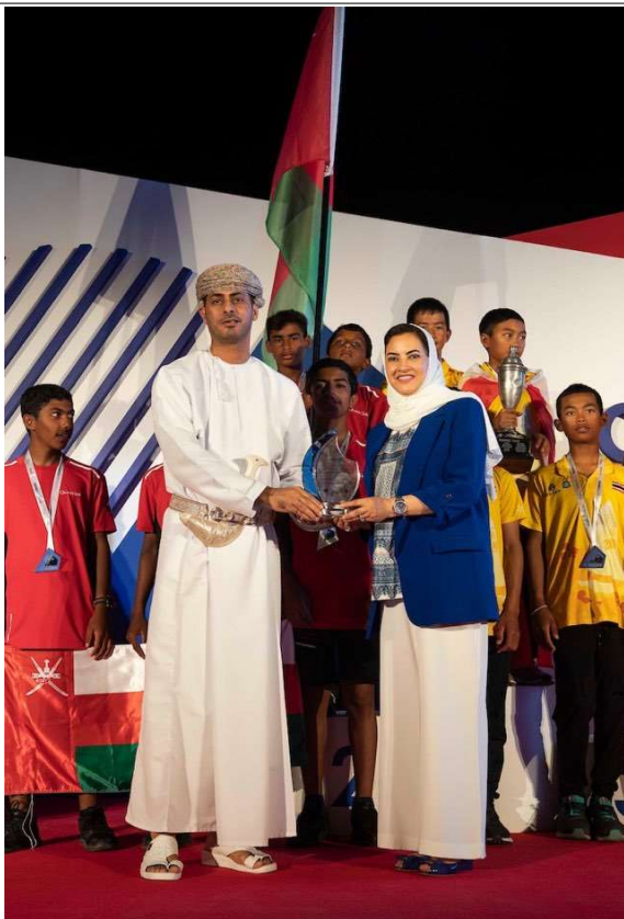
ODA 아시아 오세아니아 선수권 대회 시상식 오만 왕국 체육회 회장