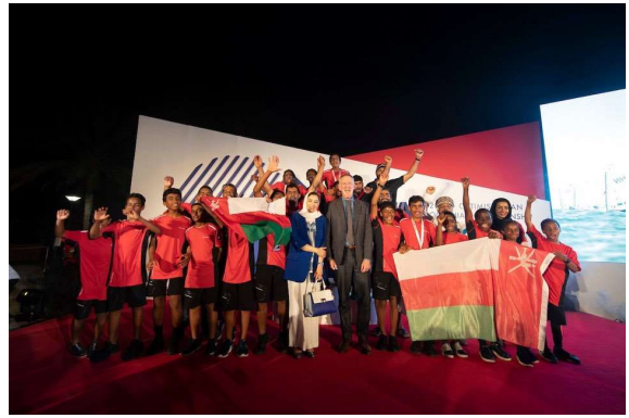
ODA 아시아 오세아니아 선수권 대회 시상식 팀 우승자