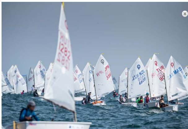
IODA 아시아 오세아니아 선수권 대회 경주 중