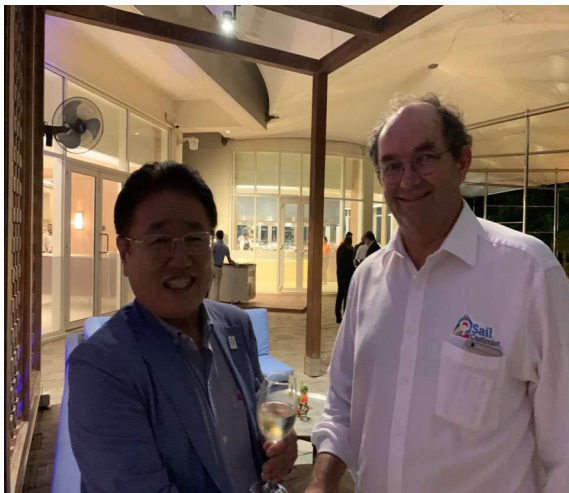
IODA 회장과 인사