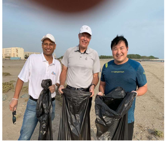
대회 전 아침 청소: 아시아 요트협회 회장, 세계요트협회 회장, 대한요트협회 이사