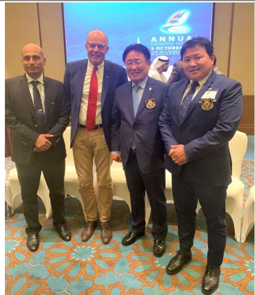
아시아요트협회 회장, 세계요트협회 회장, 대한요트협회 회장, 대한요트협회 이사