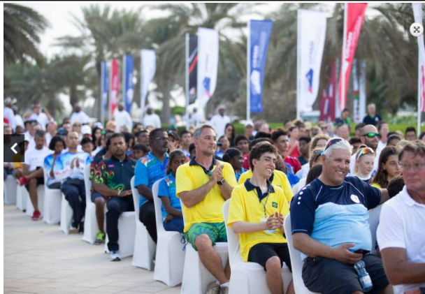
ODA 아시아 오세아니아 선수권 대회 시상식