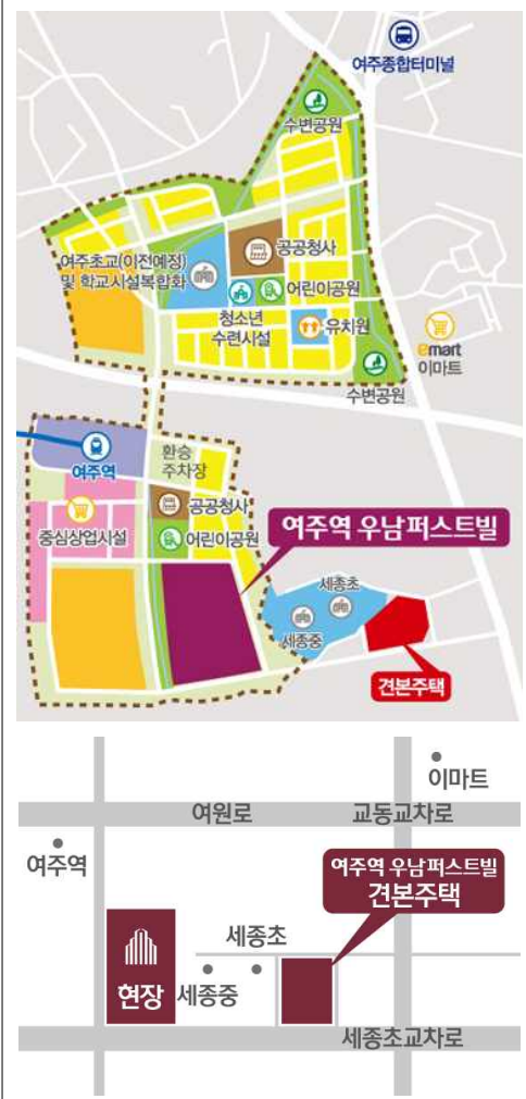
경기도 여주시 교동 119번지 일원

※ 건본주택 관람은 사전예약제로 진행될 예정입니다. 자세한 사항은 홈페이지 또는 모집공고를 참고하시기 바랍니다.