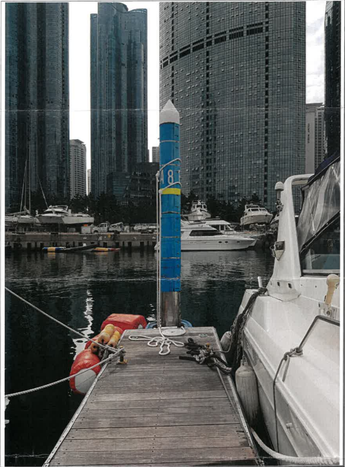
폰툰 파일 표시선(형광색 야간 반사지) 위쪽 계류색(훗줄) 보강 현장사진 예시